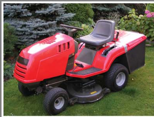
Zahradní traktůrek nebo sekačka