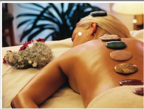
Prodloužený wellness víkend pro dvě osoby