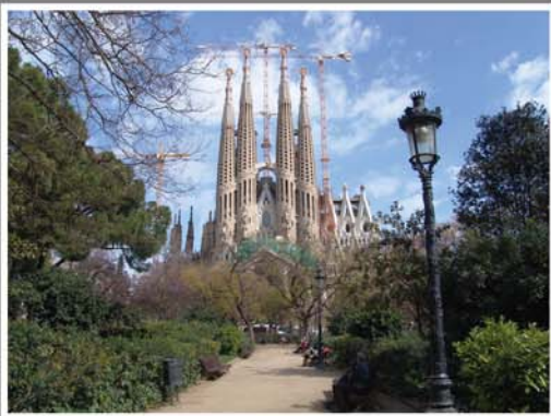
Víkend pro dvě osoby v Barceloně